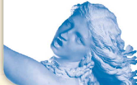
„Apollo und Daphne“ Marmor-Skulptur von Gian Lorenzo Bernini